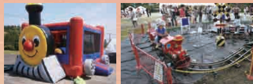
★こども広場(●ふわふわ ●豆汽車)